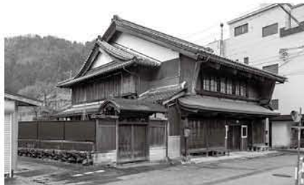
平入の町家(宿場中心部)