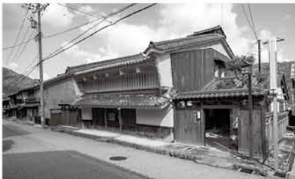
卯建を上げる町家(旧京藤甚五郎家住宅)