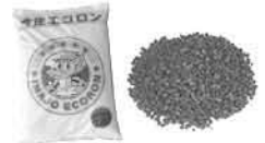
コンポスト肥料(造粒) (今庄エコロン)