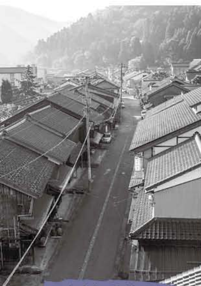
今庄宿の町並み （中心部より南を望む）

今庄宿伝建地区は、江戸時代から昭和30年代までに建てられた伝統的な建造物が歴史的な町並みを形成し、越前地方の豪雪地に発展した旧北陸道の宿場町の歴史的風致を良好に伝えています。