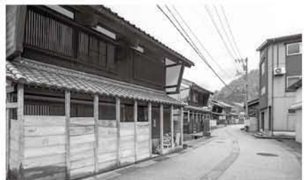
雪囲い設置の様子