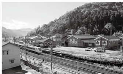
近代の建物(酒造施設)