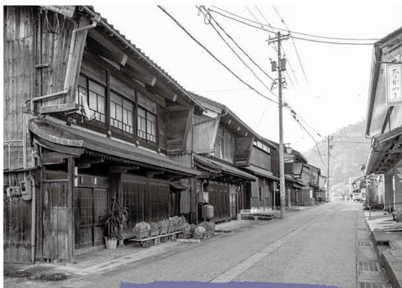
今庄宿の町並み（中心部より南を望む） 平入の町家が並び