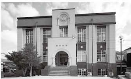
近代の建物(昭和会館)