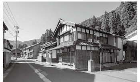
妻入の町家(宿場北側)