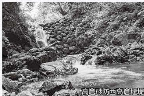
高倉砂防西高倉堰堤