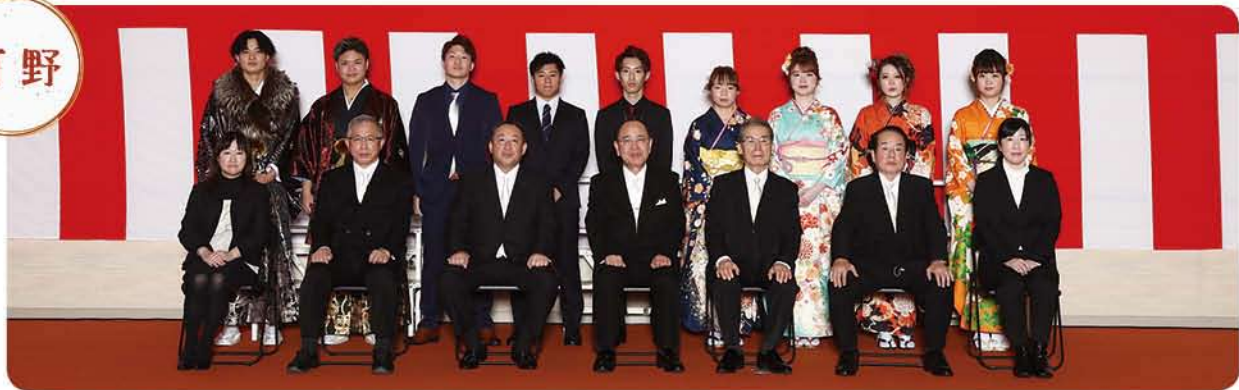
成人式を迎えられた皆さんです (50音順・敬称略)

©新成人の方のお名前は、承諾の上、掲載しています。なお、町ホームページで閲覧できる広報紙には掲載しません。