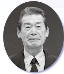
南越前町議会議長