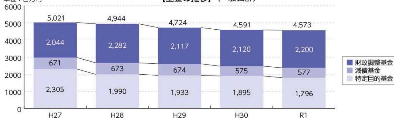
【基金の推移】（一般会計）