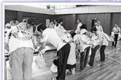
▲永平寺町上志比小学校への広域避難訓練