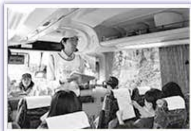
▲安定ヨウ素剤配布訓練