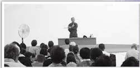
▲河野小学校に設置した放射線防護施設(エアシェルター)への要配慮者一時避難訓練

8月30日、31日に河野地区全域を対象に福井県と合同で原子力総合防災訓練を実施しました。地震による美浜原子力発電所の事故発生を想定し、原子力災害時の協定先である永平寺町への広域避難訓練と河野小学校放射線防護施設への要配慮者一時避難訓練等に河野地区の住民約200人が参加し、原子力災害時の避難行動等について理解を深めました。