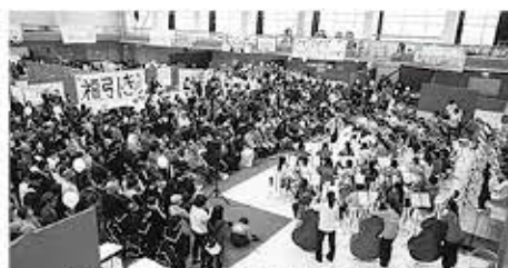
吹奏楽部の演奏で盛り上がる会場