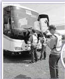
▼サンドーム福井駐車場でスクリーニング検査訓練