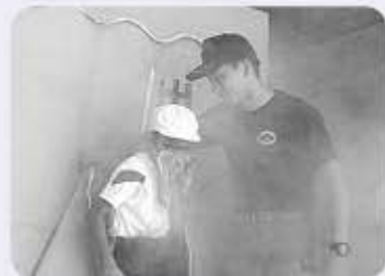
8月7日少年消防クラブ体験学習会での様子

南越前町は四季折々の楽しみがあり、人柄も良く、町内での定住を決意し、マイホームを計画中です。