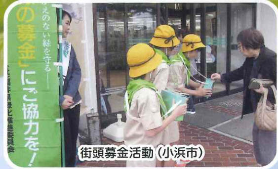
街頭募金活動（小浜市）