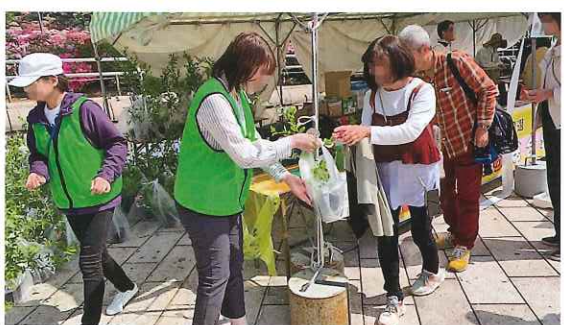
緑化苗木の配布活動 (鯖江市)