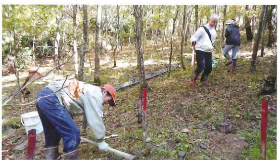
ボランティアによる森づくり活動 (永平寺町)