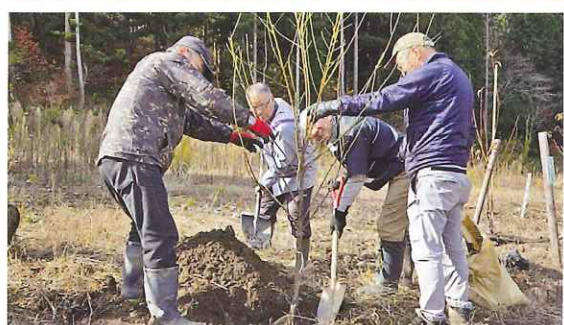
地域での緑化活動 (大野市)