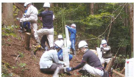
子ども達の森林学習活動 (小浜市)