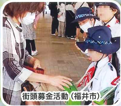
街頭募金活動（福井市）