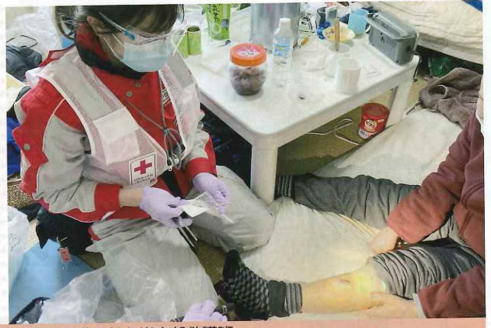
「令和6年能登半島地震」の被災地で救護活動を行う当支部救護班