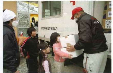
東日本大震災にて、被災者へ支援品(パン)を手渡す福井県支部ボランティア