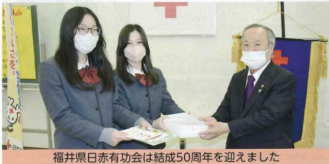
福井県日赤有功会は結成50周年を迎えました

福井県日赤有功会は、赤十字活動に賛同した有功章受章者で組織されている支援団体です。