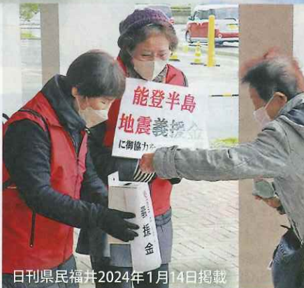
日刊県民福井2024年1月14日掲載