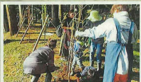
地域での植樹活動 (越前市)