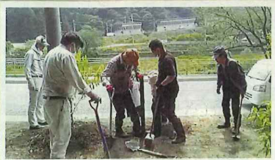
ボランティアによる森づくり活動 (大野市)