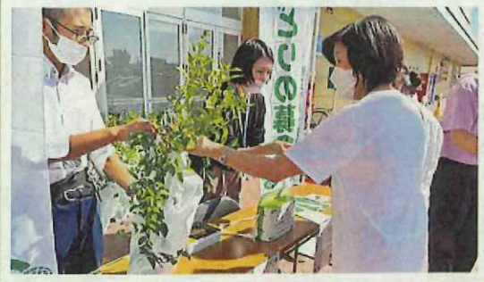
緑化苗木の配布 (鯖江市)