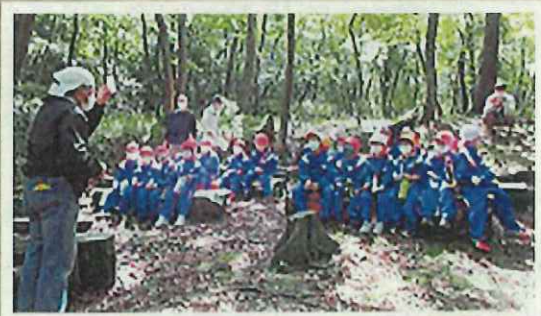
子どもたちの森林学習 (若狭町)