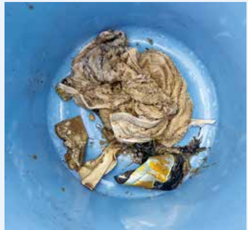
▲マンホールポンプに詰まっていた衣類や空き缶など