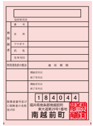
新しい負担割合証（桃色）

8月以降に介護保険サービスを利用する際は必ず新しい負担割合証（桃色）を事業者にご提示ください。