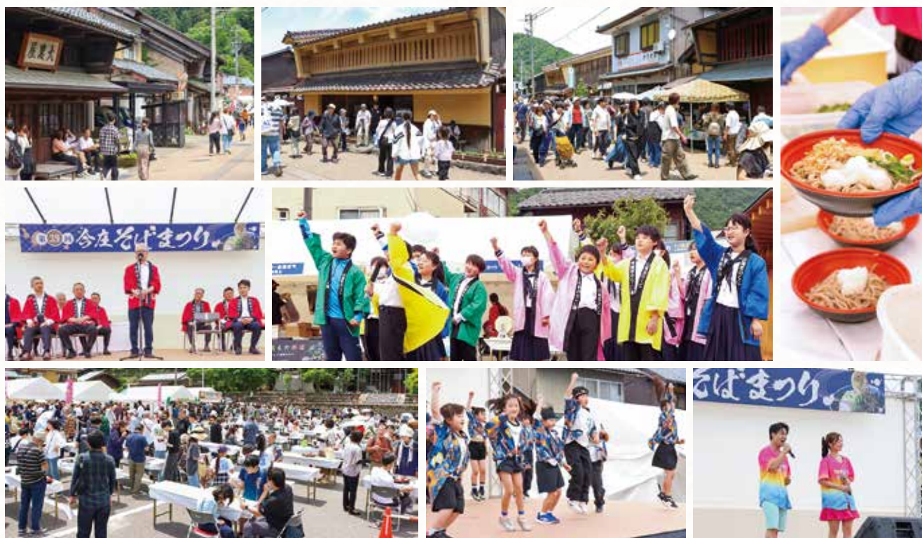
会場で活躍した MEC の様子

また、今回のそばまつりでは、関係人口ボランティア「 みなみえちぜん MinamiEchizen Crew (MEC) フルー メック 」が初めて活動し、そば店の販売補助や来場者案内、撮影・記録など、イベントスタッフとして地域住民と交流しました。