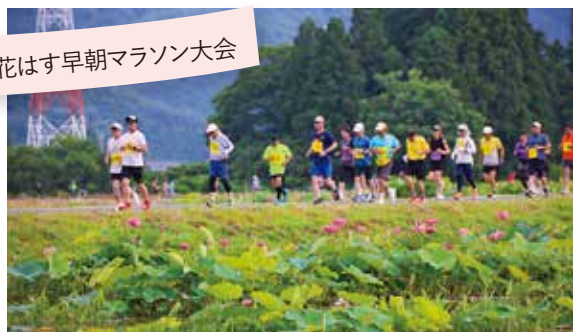
花はす早朝マラソン大会