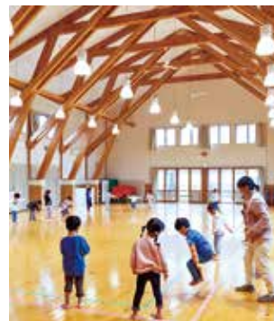
保育所・ 認定こども園