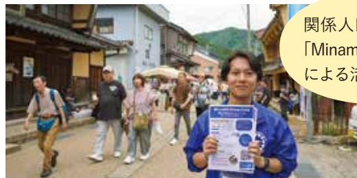
関係人口ボランティア「MinamiEchizen Crew」による活動を支援