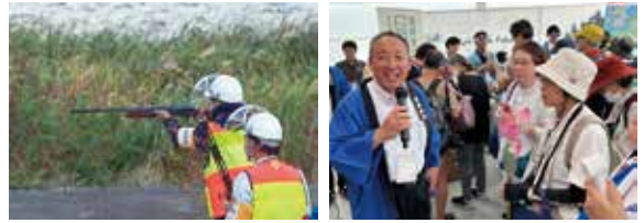
▲有害鳥獣から町民と農作物を守ります！