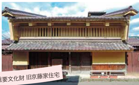
重要文化財 旧京藤家住宅