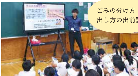
ごみの分け方・出し方の出前講座

ごみ・資源 自然環境や生活環境の保全、資源循環の推進を図り、環境意識の向上に取り組んでいます。