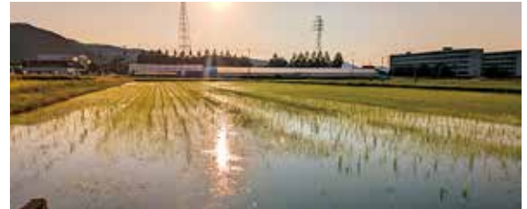
▲南越前町の美しい田園風景