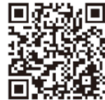
オンライン申請 二次元コード

A 自宅等でマイナンバーカードを使ったオンライン申請、郵送での申請ができます。証明書は郵送で自宅に届きます。