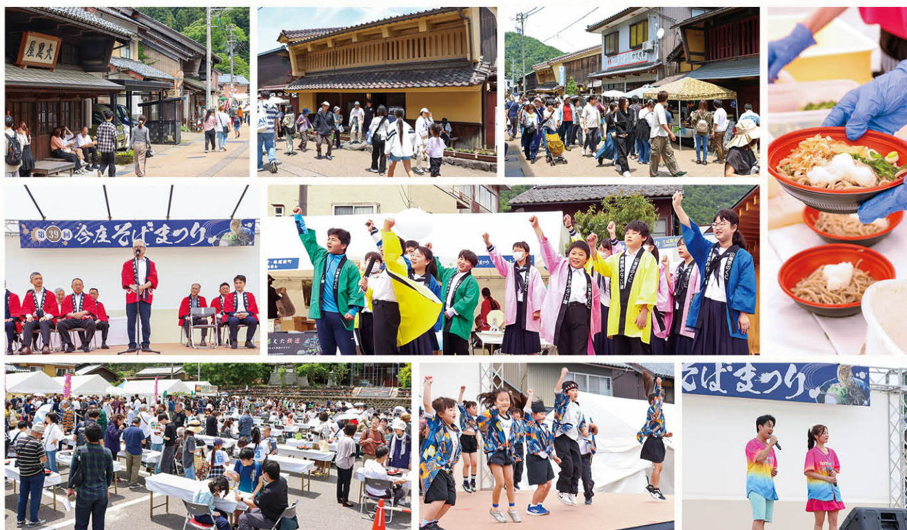
会場で活躍した MEC の様子

また、今回のそばまつりでは、関係人口ボランティア「 みなみえちぜん フルーメック」が初めて活動し、そば店の販売補助や来場者案内、撮影・記録など、イベントスタッフとして地域住民と交流しました。