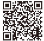
町議会 ホームページ

議場の主役は議員ですが、その舞台裏を支えるのが議会事務局です。会議の準備から議会だよりの発行まで、「議会がきちんと動く当たり前」を支えながら、町民と議会の架け橋となるお手伝いをしています。