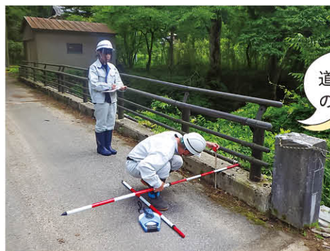
道路橋梁等の安全点検