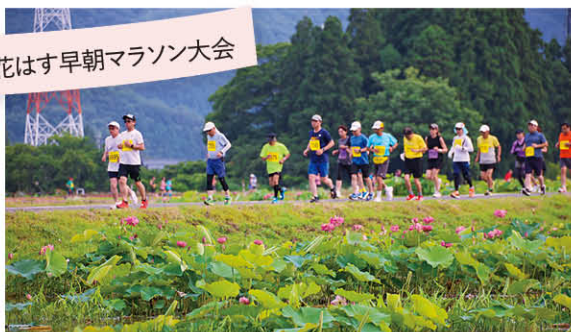
花はす早朝マラソン大会