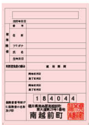
新しい負担割合証（桃色）

8月以降に介護保険サービスを利用する際は必ず新しい負担割合証（桃色）を事業者にご提示ください。