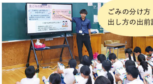
ごみの分け方・出し方の出前講座

ごみ・資源 自然環境や生活環境の保全、資源循環の推進を図り、環境意識の向上に取り組んでいます。