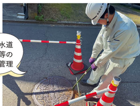
上下水道施設等の維持管理