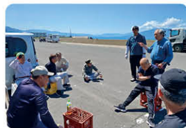
集落の皆さまとの話し合い