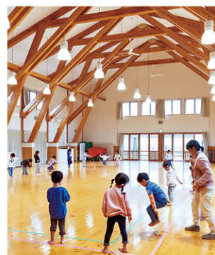
保育所・ 認定こども園