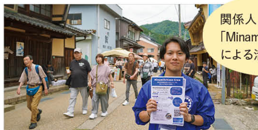
関係人口ボランティア「MinamiEchizen Crew」による活動を支援