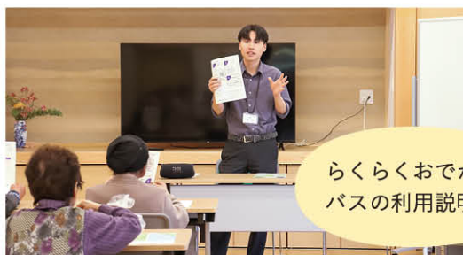
らくらくおでかけバスの利用説明会

公共交通 生活を支える地域の大切な移動手段である公共交通の維持と発展、利用の促進を図っています。