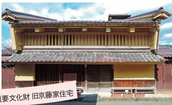
重要文化財 旧京藤家住宅