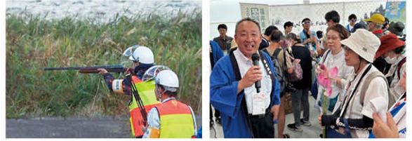
▲有害鳥獣から町民と農作物を守ります！