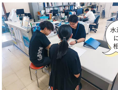
水道や住宅に関する相談対応