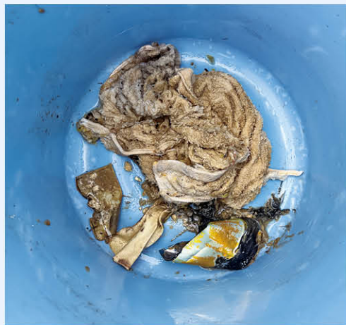
▲マンホールポンプに詰まっていた衣類や空き缶など