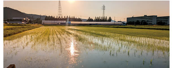
▲南越前町の美しい田園風景