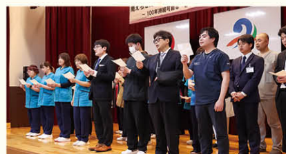
出席者による合唱