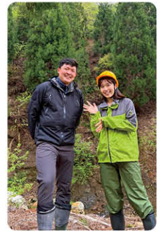
現場で林業の魅力を 語りました