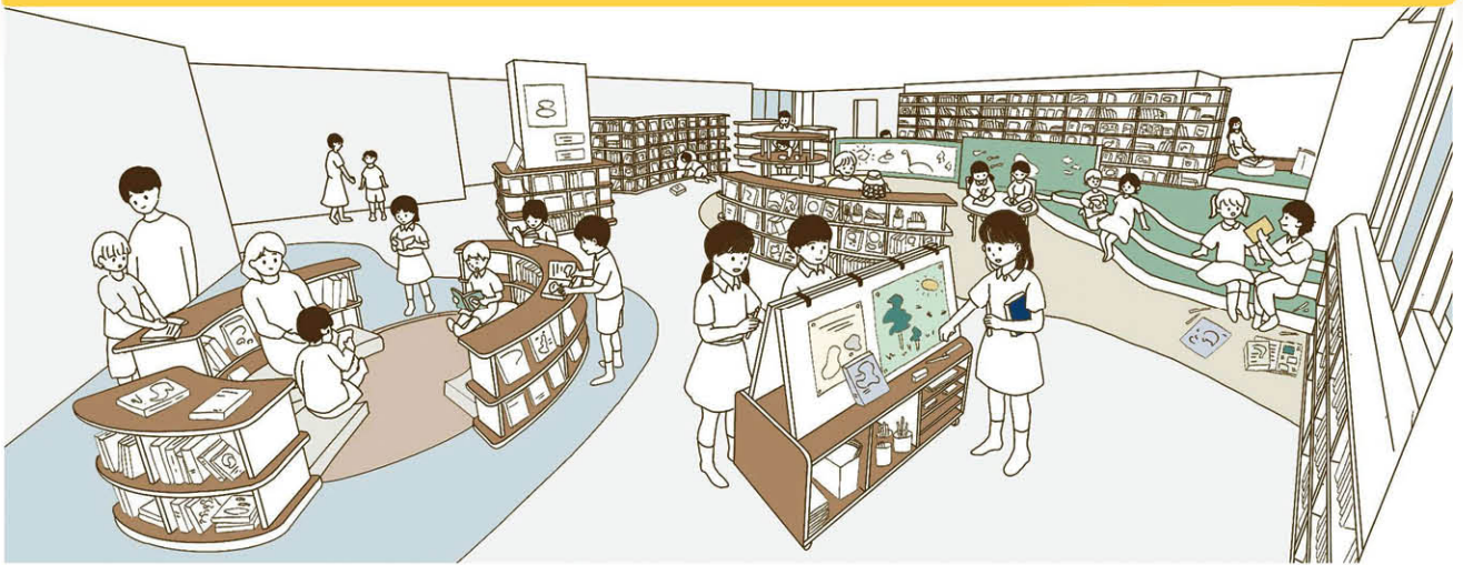
整備イメージ（令和9年春頃供用開始予定）