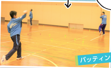
バッティング練習