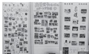
▲南越前町スポーツ少年団