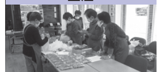
▲今庄地区女性福祉の会