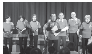
▲うたおう会「柝の木」