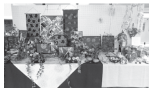
▲フラワーデザイン