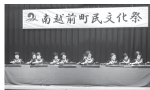
▲今庄大正琴グループ