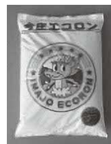
◀コンポスト肥料(造粒)