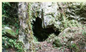
▲ハート形の洞窟「姫穴」