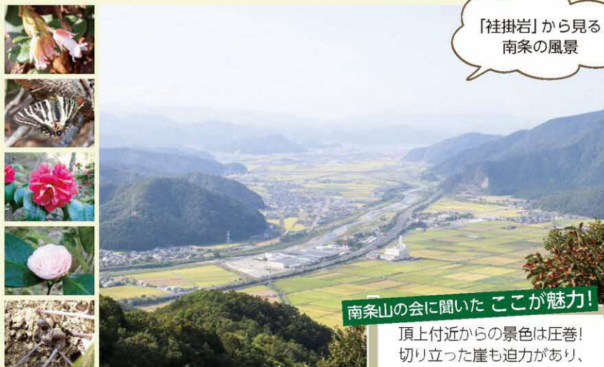
「袿掛岩」から見る 南条の風景

今庄宿を見下ろすことのできる山。山頂までの道には、かつて旧北国街道の要所であった湯尾峠や、八十八ヶ所巡礼の道などがあります。さらに尾根付近には、とても広い範囲にブナ林が広がっており、風が気持ちよく通り抜けます。