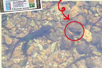
▲ヤシヤゲンゴロウとイモリ