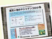
ヤシヤゲンゴロウ

福井県と岐阜県の県境に位置する山。 山頂付近には、龍神伝説の言い伝えがある神秘的な霧団気の「夜叉ヶ池」があり、固有種である「ヤシヤゲンゴロウ」が生息しています。よく目を凝らして池を観察すると見えることもあります。左の写真には、ヤシヤゲンゴロウとイモリが写っています。