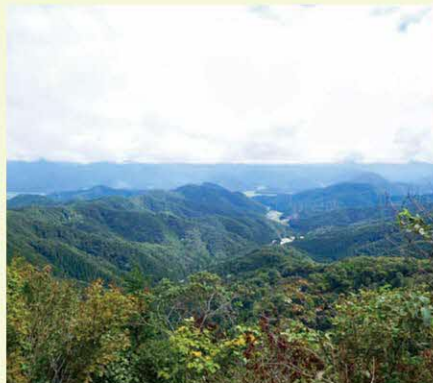
▲菅谷峠付近からの眺め

ホノケ山には昔、異変を知らせるのろし台があったことから、常に火の気に気をつけたことが「火」が「ホ」に転化し、「ホノケ山」になったと言われています。 ブナ林の中に「切り通し」と呼ばれる深く掘られた道があります。この道は昔、塩を運ぶために使われていたため「塩の道」と呼ばれ、歴史を感じることができます。