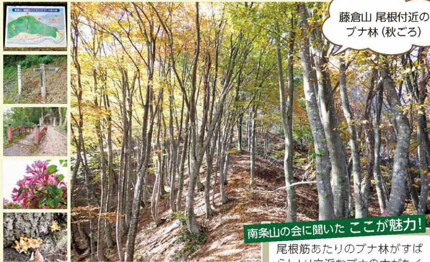
藤倉山 尾根付近の ブナ林 (秋ごろ)