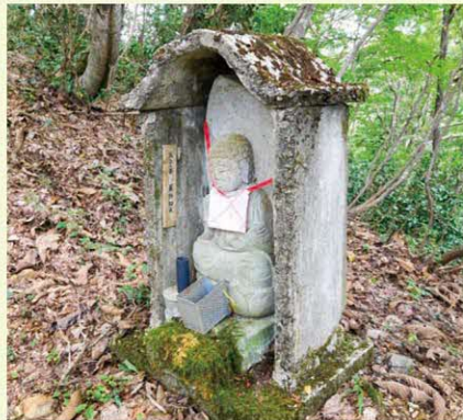
▲八十八ヶ所巡礼の地藏

尾根筋あたりのブナ林がすばらしい!立派なブナの木がたくさん生えていて圧倒されます。