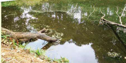
▲近くで見た武周ヶ池