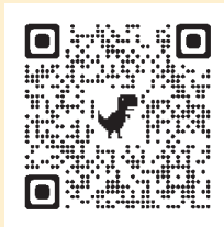
▲ふるさとチョイス

令和4年度は、47,870,000円(1,899件)のご寄附が寄せられました。 現在取扱中の返礼品については、ふるさと納税サイト「ふるさとチョイス」、「ふるなび」、または「楽天ふるさと納税」よりご確認ください。