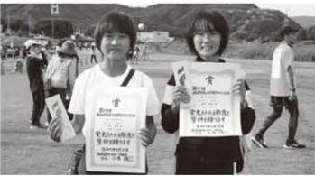
2km小学生女子 〔総合〕 1位・4位