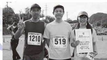
10km40歳以上男子 〔町民の部〕 1位