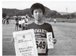
2km小学生男子 〔総合〕 1位