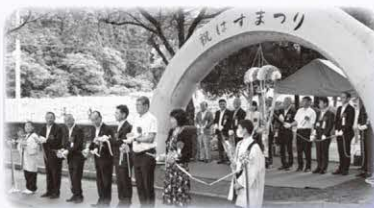
▼テープカットとくす玉開披