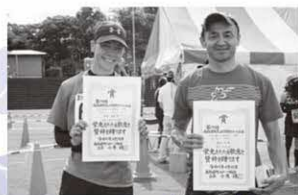
10km40歳以上女子 〔町民の部〕 3位、 10km50歳代男子 〔町民の部〕 2位