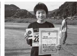
2km小学生女子 〔町民の部〕 3位