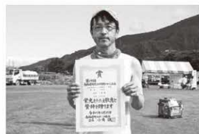
5km40歳以上男子 〔町民の部〕 1位