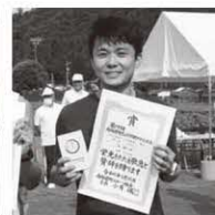
5km39歳以下男子 〔町民の部〕 1位