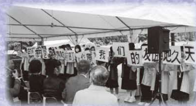
▲台湾語で歓迎のあいさつ をする みなこい隊