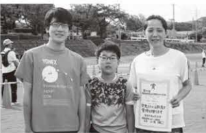
3km一般女子 〔町民の部〕 1位