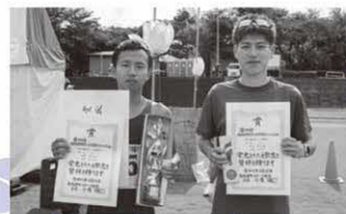
10km39歳以下男子 〔総合〕 1位、 5km39歳以下男子 〔総合〕 2位