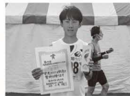
3km中学生男子 〔総合〕 2位