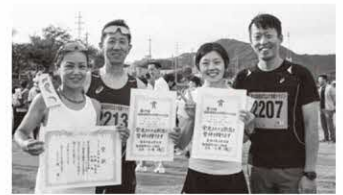
2kmファミリー夫婦 〔総合〕 1位・2位