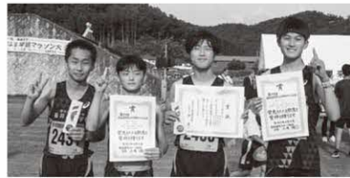
2kmペアラン 〔総合〕 1位・3位