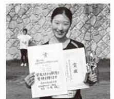
3km一般女子 〔総合〕 1位