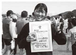
3km中学生女子 〔町民の部〕 1位