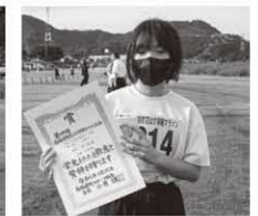
2km小学生女子 〔町民の部〕 2位