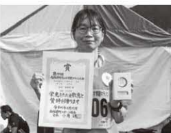
5km40歳以上女子 〔町民の部〕 1位