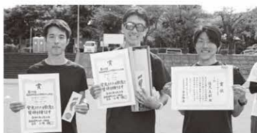
5km40歳以上男子 〔総合〕 1位・6位