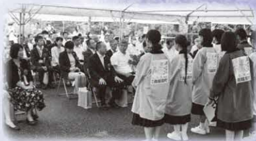
▲花はすにまつわる発表を行う みなこい隊