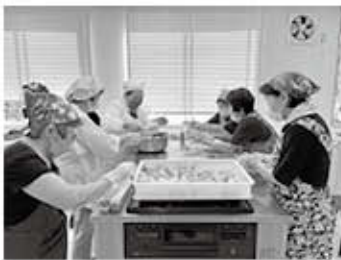
令和4年8月豪雨の際は炊き出し活動を行いました。