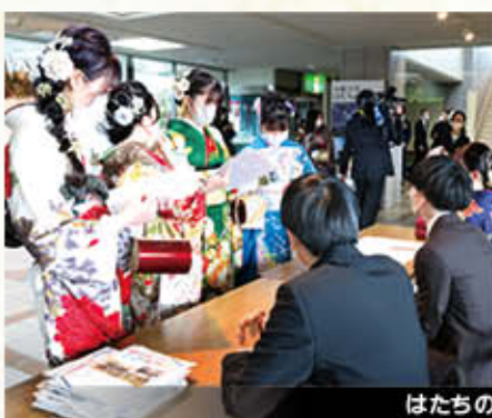
はたちのつどい受付