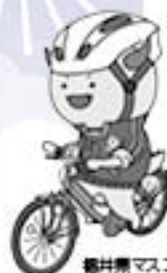
福井県マスコットキャラクターはぴりゅう