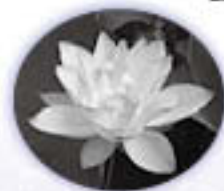
昨年は6月21日に「巨鯨の彩雨」が開花しました。

※正解者多数の場合は、抽選で決定します。 なお、当選者の発表は賞品の発送をもって代えさせていただきます。