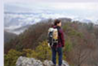
【南越前町観光連盟賞】