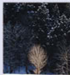
【南越前町今年観光協会賞】