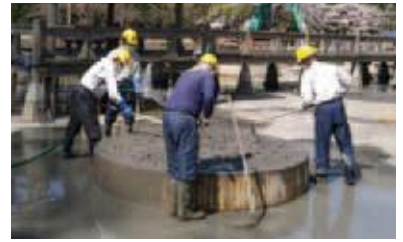
花はす公園での作業風景

花はす公園では毎年4月に、重要な作業である植替を行っています。 蓮は生育旺盛な植物であり1年で鉢植えの中は地下茎や蓮根でいっぱいになってしまいます。そこで養分をしっかりと含んだ新しい田土に植替えしスペースを確保してあげることで、伸び伸びと成長することができるのです。