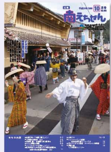
▶平成21年度 知事賞受賞 (写真部門) No.58 (平成21年10月号) 「羽根曾踊り」