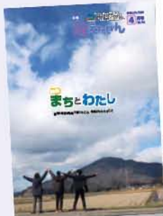
令和2年度 優秀賞受賞 (広報紙部門) No.184 (令和2年4月号) 「まちとわたし」