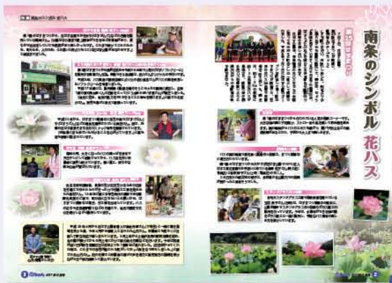
◀平成29年度 優良賞受賞 (広報紙部門) No.152 (平成29年8月号) 「南条のシンボル花ハス」

広報「南えちぜん」は、平成17年1月11日発行の創刊号から、今回の令和3年8月号で200号を迎えました。その時々のか「まちのかお」が紙面を飾っています。町民の皆さまにお知らせしたい情報やまちの動きなど、わかりやすく正確に伝えられるよう、読みやすい紙面づくりを心がけています。これまでに発行した広報紙の中で、福井県広報コンクールで受賞した広報紙をいくつかご紹介します。