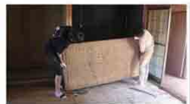
桜井市 空き家の畳上げ