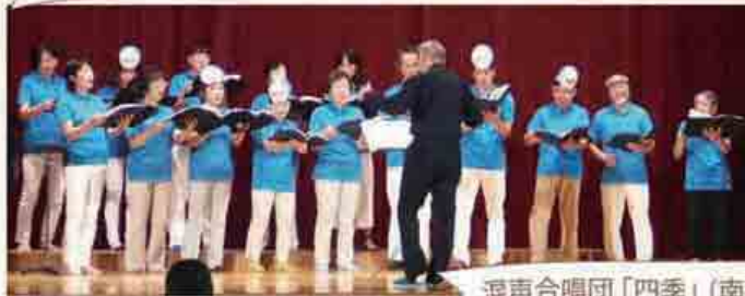
混声合唱団「四季」(南条文協)