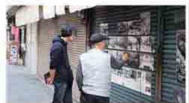
豊岡市 市街地フィールドワーク