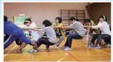
南越前町 宅良地区運動会