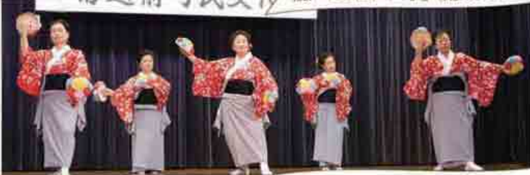
糠どっさり保存会(あやめ会)