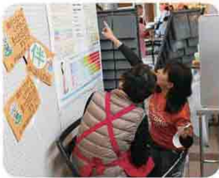
▲南条地区文化祭の様子

認知症について心配なことや、介護方法等について分からないことがあれば気軽に地域包括支援センターまでご相談ください。また12月には男性介護者を対象とした「介護者のつどい」もありますので、是非ご参加ください。