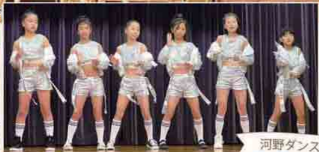
河野ダンスクラブ