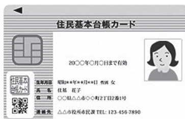
▶住民基本台帳カード