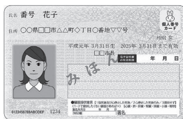
▶マイナンバーカード