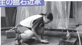
北前船主の館右近家

来館者の受付や館内の清掃などを行いました。施設をきれいにすることや訪れた方との会話で仕事の大変さややりがいを学びました。