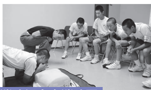
南越消防組合南消防署

来館者の受付や館内の清掃などを行いました。施設をきれいにすることや訪れた方との会話で仕事の大変さややりがいを学びました。