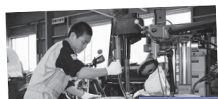
株川端モータース

タイヤのホイールを取り外したり車両の洗車などを体験しました。覚えることがたくさんあり難しいけれど、仕事の楽しさを味わえました。