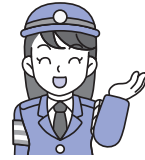
南越前町交通指導員