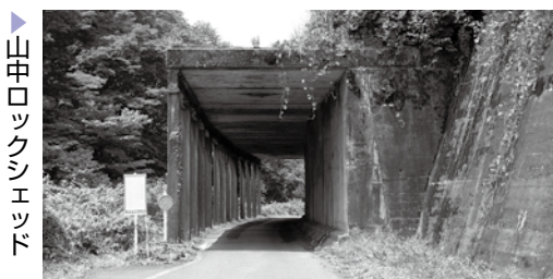
▶山中ロックシェッド

山中トンネル 延長1170mと現存する11本のトンネルで最も長く、当時は国内屈指の規模を誇った煉瓦造の鉄道隧道でした。固い岩盤や湧水による崩落など難工事の末に完成しました。