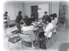
第1回 つどいの風景

日 時 10月17日(土) 午後2時～4時頃まで 場 所 ほのぼの苑 1階相談室 内 容 「認知症ケアと施設での取り組み」 講 師 ほのぼの苑職員 対象者 在宅にて認知症の方を介護されているご家族など *資料等準備のため事前にお申込みください。 定 員 20名 申込み 地域包括支援センター ☎ 47-8009 締 切 10月9日(金)