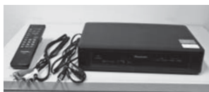
(回収物) ホームターミナル リモコン・ケーブル2本