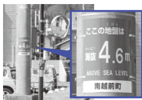
▲海拔表示版の設置 (国道305号沿い)