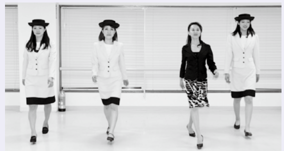
▲講師の方からウォーキングの指導を受ける3人

故郷の魅力を県内外の人たち、いろいろな世代の人たちに知ってもらいたいと思ひ、応募しました。南越前町で生まれ育ったからこそ分かる、このまちの良さを伝えていきたいです。たくさんの方との出会いを大切に、笑顔で頑張ります!!