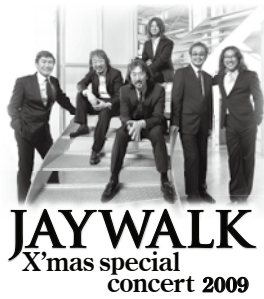
JAYWALK X'mas special concert 2009