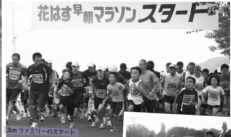
2km ファミリーのスタート