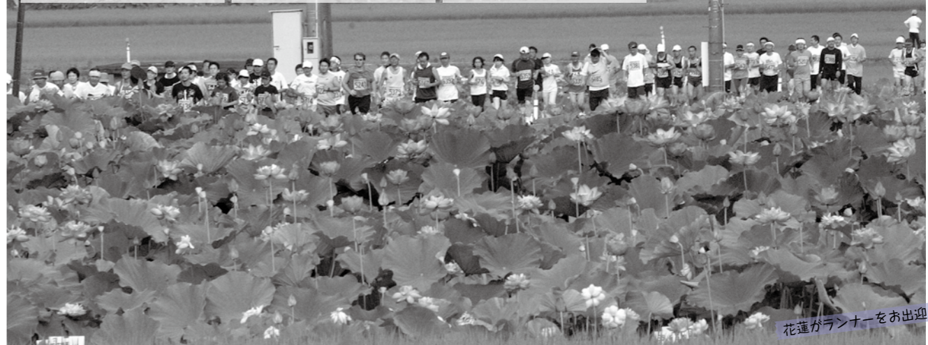
花蓮がランナーをお出迎え

ひとことだけ 今年も大変楽しんで花はすマラソンに参加しました。おかげで、南越前町の発展と町民の健康の向上に貢献できたと感じています。花はすマラソンをこれからも応援していきます。ありがとうございました。 ひとことだけ 花はす早朝マラソンは初めての参加でした。暑さや疲れはありますが、おかげで、南越前町の発展と町民の健康の向上に貢献できたと感じています。花はすマラソンをこれからも応援していきます。ありがとうございました。 ひとことだけ 花はす早朝マラソンは初めての参加でした。暑さや疲れはありますが、おかげで、南越前町の発展と町民の健康の向上に貢献できたと感じています。花はすマラソンをこれからも応援していきます。ありがとうございました。