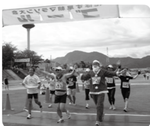
真夏にサンタがやってきた！「みんなで楽しく走りました。来年も参加します」