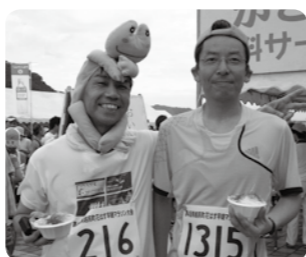
毎年参加の力エルさん。「サービス・応援など全てが素晴らしい」