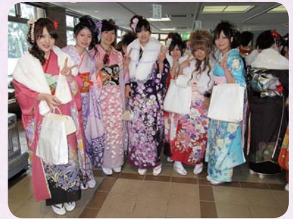
▼久しぶりに再会した旧友たちとたくさん記念撮影をしました。