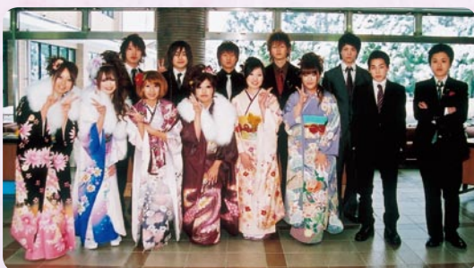
▲実行委員会のみなさん。