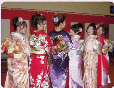
▲後姿も艶やか!! みなさん美しい!!