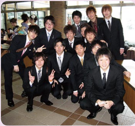
▼“純白”の門出！ 雪が新成人をお祝いしてくれました。