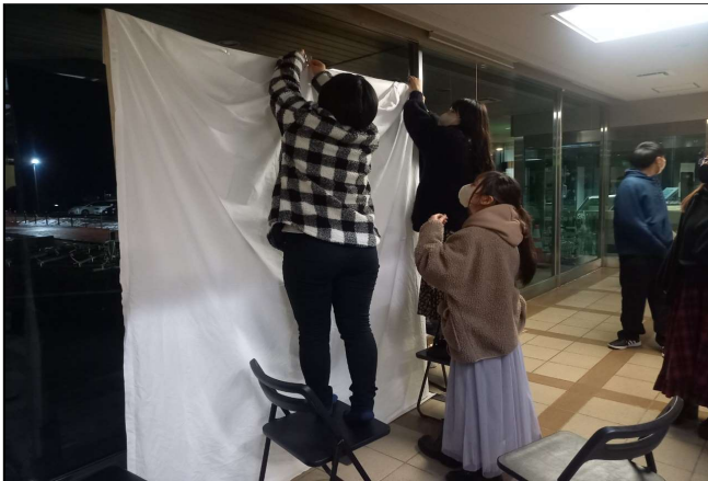
青年交流事業に参加