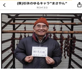
人生で大切なことは"因果応報"です。