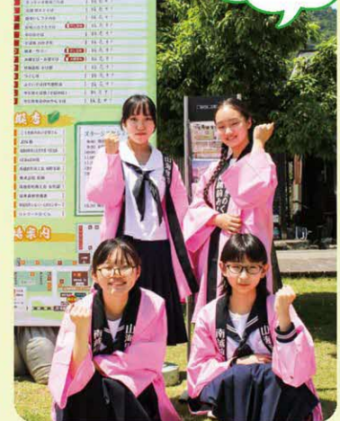
南越前みなこい隊