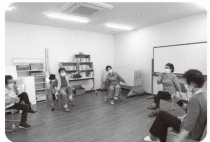
ファミリーマート+ハーツ 河野北前船主通り店