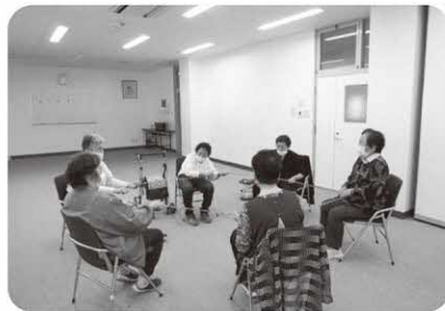
今庄住民センター