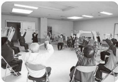
南条保健福祉センター

※開催日が祝日の場合は、別日に振替えています。詳細は町民カレンダーをご覧ください。