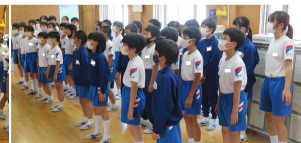
昼休みの練習風景