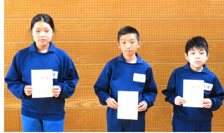
前期児童会会長・副会長