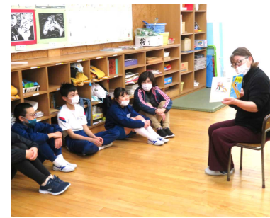
なかよし・ひまわり学級