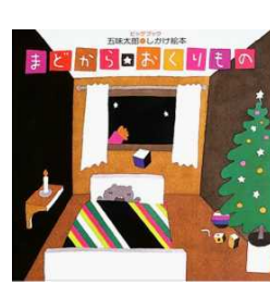
まどからのおくりもの