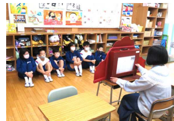
なかよし・ひまわり学級