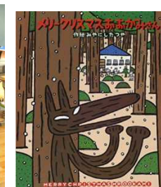
クリスマスおおかみさん