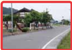
5 子供が遊んで道路に飛び出すと危険。