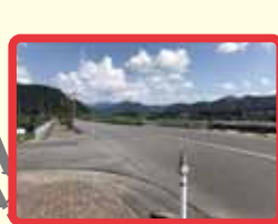
8 橋が工中なので横断することはないが、交通量が多く、スピードを出す車も多いので危険。