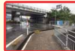
14 スリップした車が歩道に突っ込んでくるおそれがあり危険。