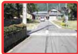
7 公園の向かいにブロック塀があり、人や車が見えにくい。