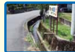
17 通学路の両側に流れが速く、柵がない用水路がある。