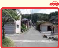
1 坂から降りてくる車に注意が必要。