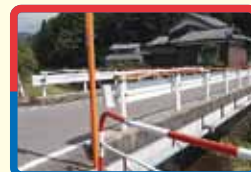
12 川の近く。歩道がとても狭い。