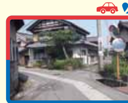
11 三叉路の交差点あたり、道路も狭く、道路の端によると溝もあり危険。