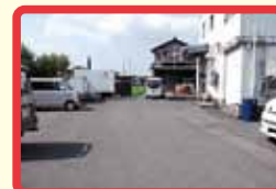
13 A コープの裏にあたり、車の出入りがあり危険。