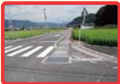
4 歩道がなく、交通量が多い。