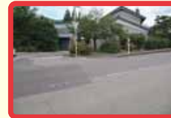
15 交通量が多いのに、横断歩道がない。スピードを出す車が多い。