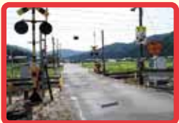
6 道幅が狭く、車一台しか通れない踏切がある。また、踏切付近の道には水田があり、高さがあって落ちると危険。