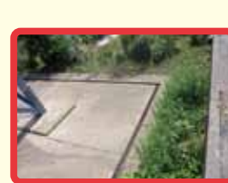
10 道路と田んぼの間で高いところがある。(落ちるとけがをする。)