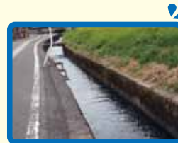
9 用水路が多く、流れも速く危険。