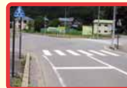
16 横断歩道を2回渡る必要がある。大型車両がスピードを出して通り、交通量が多い。