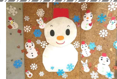
掲示物にも変化が・・・バレンタインバージョンに