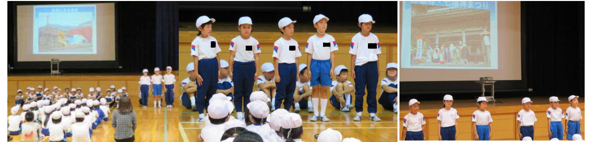
南条小学校や南条地区の様子について、上手に紹介していました。

6月20日(木)、河野小学校と河野梅園を会場に、郡小学校3年生合同学習会を行いました。郡内の4小学校から103人(南条小50人、湯尾小14名、今庄小21名、河野小18名)の児童が集まりました。河野小学校会場では、各学校ごとに学校紹介をし、その後、4チームに分かれてドッチボールを2試合しました。また、河野梅園会場では、梅もぎ体験を行いました。今年の梅は、小粒ですがきれいな梅が豊富に実っていました。児童の中には、「家の人を楽しみにしているから」、「おばあちゃんがきっと喜ぶだろうな」と、持ってきた袋が一杯になるまで梅をもいでいた子もいました。たくさんの梅を持ち帰りましたので、梅シロップや梅干し等にして、おうちでもお楽しみください。