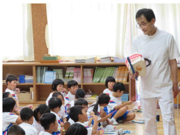
歯の王様 6歳臼歯(1年生)