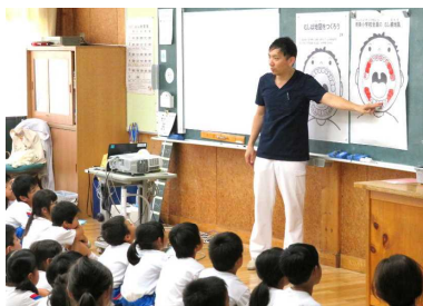
むし歯になりやすい歯はどこかな(2年生)