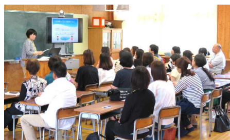
親子の関わり方(5年生保護者)