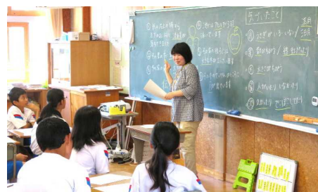
伝えるってどういうこと?(6年生)

6月13日(木)の午前中、多くの方々に授業参観に来ていただきました。教科の授業に加え、「スマホ・ケータイ安全教室」や「学校保健委員会」も行いました。「スマホ・ケータイ安全教室」では、1～5年生とその保護者を対象に、「携帯電話やスマホ等の正しい使い方」や「犯罪や非行の未然防止」について学習しました。また、「学校保健委員会」では、学校歯科医の先生による「6歳臼歯」(1年生)や「むし歯になりやすい歯」(2年生)について、栄養教諭による「おやつを食べ方」(3年生)や「よく噛んで食べること」(4年生)について、スクール・カウンセラーによる「親子の関わり方」(5年生保護者)や「伝えるということ」(6年生)について学習しました。