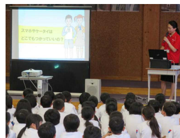
スマホ・ケータイ安全教室(1～3年・4～5年)