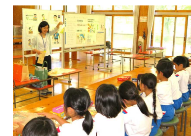
おやつを食べ方について考えよう(3年生)