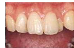
きれいな歯も、 染め出しすると →