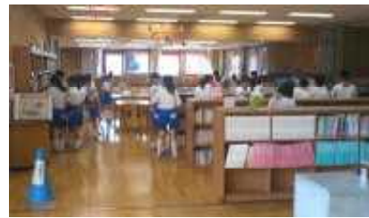
朝の図書室の様子

毎朝、朝読書用の図書を借りるため、図書室には多くの児童が来室し、各自が貸出用パソコンを使って、貸出・返却を行っている。