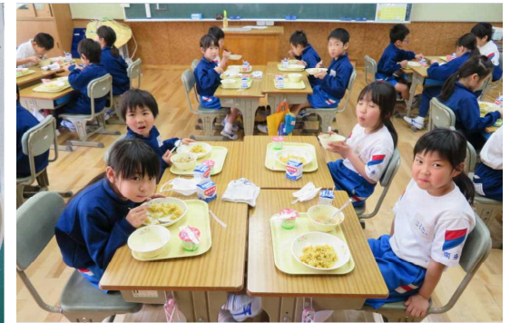
2年1組の給食の様子

今年度初めての給食は、メキシカンライス、豆乳みそスープ、ヨーグルト、牛乳でした。進級・入学をお祝いする意味を込めて、豆乳みそスープの中には、祝という赤い文字の付いたナルトが入っていました。なお、お気づきの方もいらっしゃると思いますが、牛乳がビンではなく紙パックになっています。全国の学校給食では紙パックが7割と主流だそうです。県内は昨年度までビンが9割を占めていました。今年度からは業者の配送の効率性から紙パックに変更になりました。「ビンは紙パックより重い上、運ぶためのケースはビンとビンの間を仕切らなければならず容積も大きくなる。配送トラックには回収したビンを載せるスペースも確保する必要があり、1回に積める量は紙パックの方が1.5倍から2倍になる。これにドライバーの人手不足も加わり、紙パックに変えてもらわないと物理的に配送が不可能である。」という理由だからだそうです。これもひとつの時代の流れなのではないでしょうか。ビンの牛乳を飲むということが懐かしい思い出になりそうです。