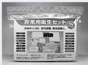
▲非常用衛生セット

1月25日の区長発送において、マスクやウェットティッシュなどが入った非常用衛生セットを各戸1セットずつ配布しました。以前に配布した非常持出袋とともに、非常時には避難所などで有効にご活用ください。